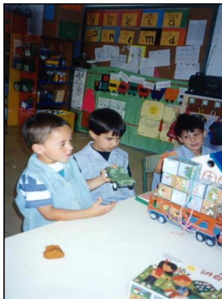
Ilustración 92: Todo el ambiente del aula, los carteles, los tabloncillos de información, los juguetes... constituyen una invitación al dominio de los sistemas simbólicos.