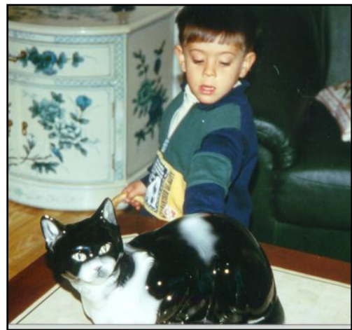
Ilustración 88: Uno de los primeros objetivos que tenemos que fijarnos, a la hora de trabajar las imágenes, consiste en favorecer acontecimientos en los que el niño/a tenga que diferenciar entre la realidad (gato) y la imagen de esa realidad (figura de cerámica que representa o parece un gato).