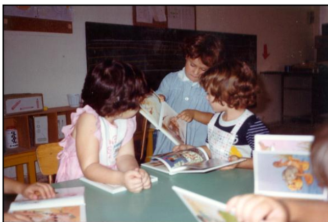
Ilustración 90: Los cuentos ilustrados son imágenes que nos ayudan a comprender el mundo de las representaciones icónicas. Al mismo tiempo, los alumnos/as se inician en la lectura...