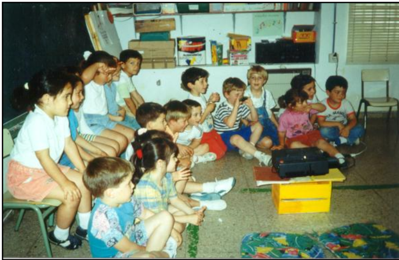
Ilustración 91: La observación de imágenes se puede realizar de varios modos. Con láminas impresas en soportes bidimensionales (cada editorial suele disponer de una colección). Y con imágenes proyectadas (diapositivas).

En las verbalizaciones adquieren mucha importancia los adverbios, los adjetivos, los verbos, las oraciones copulativas y subordinadas... Y la riqueza del vocabulario.